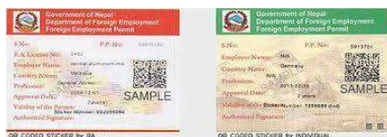
パスポートに貼られる出国許可シール

ネパールから海外へ出国する際には、海外就労許可が必要になります。技能実習、特定技能に関しては事前にネパール大使館を通じて許可を得てください。