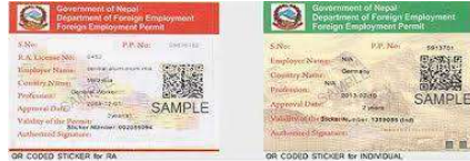
パスポートに貼られる出国許可シール

ネパールから海外へ出国する際には、海外就労許可が必要になります。技能実習、特定技能に関しては事前にネパール大使館を通じて許可を得てください。